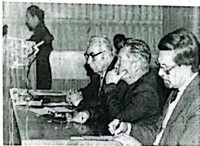
На снимке: отчетно-выборное собрание ветеранов СамГТУ. 1986 г.

Когда проходит молодость, Длинные ночи кажутся, Что раньше было сказано, Теперь уже не скажется. Не скажется, не забудется, А скажется забудется, Когда проходит молодость, То по другому любится. Но что нам в жизни советать, На то, что ночи длинные? Еще полны рассветами Все noch соловьиные, Коль ночи соловьиные, Поют кусты жасминовые, И ты, как прежде, кажешься Кудрявою рябиною. Пускай густые волосы Подернулись иедем, Глаза твои усталые Мне кажутся красивее. Что не сбилось, то забудется, Навеки не забудется, Когда проходит молодость, Еще сильнее любится.