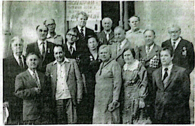
На снимке: ветераны электротехнического факультета в День 40-летия Победы.

Мы регулярно получаем приглашения на торжественные вечера, бесплатные билеты в драматический и оперный театры. В доме архитектора наши ветераны прослушали лекцию «Династия Малюковых», просмотрели компьютерную выставку картин Н. К. Рериха. Ознакомились с работами Ильи Глазунова и его учеников. В институте культуры прослушали концерт из произведений Баха и Шопена. Трижды по билетам, выделенным районным Советом ветеранов, совершили