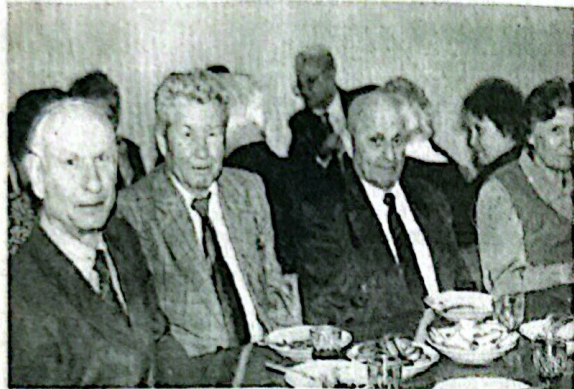
На снимке: ветераны СамГТУ отмечают День защитника Отечества. 1996 г.

Поздравляем вас с Днем пожилого человека! Низкий вам поклон за ваш труд, вашу мудрость и героизм, силу воли и сердечную теплоту, неиссякаемую энергию и жажду жизни. Искренне желаем вам сохранить эти лучшие качества на долгие-долгие годы. Здоровья вам, счастья и радости! Ректорат. Профком сотрудников. Профком студентов. Редакция газеты "Инженер".