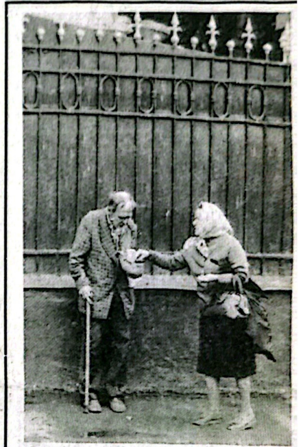
1 октября в нашей стране отмечается День пожилого человека. Такую картину как на этом снимке, часто можно увидеть в Самаре, да и во всех российских городах. А как живут пенсионеры-ветераны нашего вуза, вы узнаете на 2-й и 3-й страницах номера.

9-й. Напротив, собрание было деловым. Ректор сказал, чтобы со всеми коммерческими предложениями люди шли в ректорат. Ведь посмотрите, наши специалисты все-таки не разбегаются, а почему? Да потому, что настоящий специалист себя прокормит, лишь бы у него была свобода действий на заключение договоров, совмещение. И такая свобода у сотрудников нашего университета есть. И все, кто с головой, ею пользуются и зарабатывают.