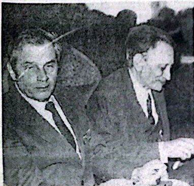
Ветераны СамГТУ в День защитника Отечества. 1996 г.

Разворот подготовлен Советом ветеранов войны и труда СамГТУ