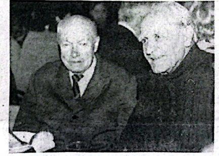
Ветераны СамГТУ празднуют День Победы и День защитника Отечества.